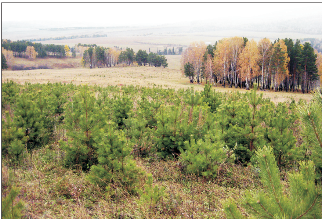
Рис. 2. Формирующийся молодняк сосны обыкновенной на участке бывшей пашни в Емельяновском районе Красноярского края.