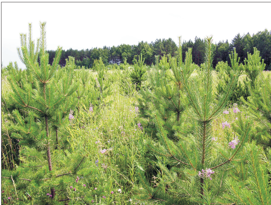
Рис. 1. Зброшенне поля в Емельяновском районе Красноярского края, зарастающие сосной обыкновенной.